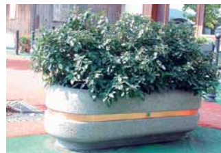
Cristina -kuparirengaskoristeella. Altaan kiertävä Iroko-puupenkki saatavana Cristina B -altaaseen.