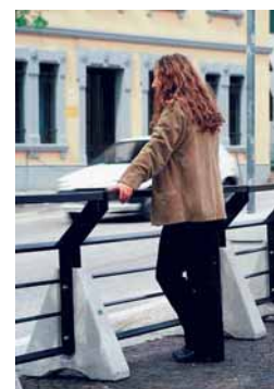
Betonijalusta ja teräsaita

Aitaelementin leveys 870 tai 1650 mm. Korkeus 900 mm.