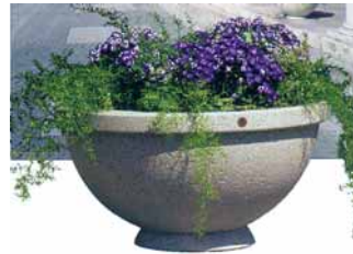
Cosmoarredo Saatavana myös kuparikuorella.