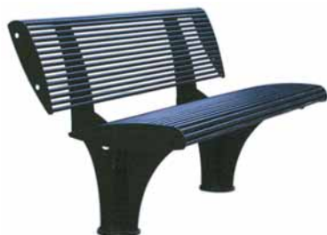
Zebra-teräspenkki - betoni tai teräsjalusta

Istuin- ja selkäosa 15 mm:n teräspuutkea. Harmaa RAL 7021 pinnoite tai ruostumaton teräs. Pituus 1500 mm, korkeus 729 mm, syvyys 635 mm.