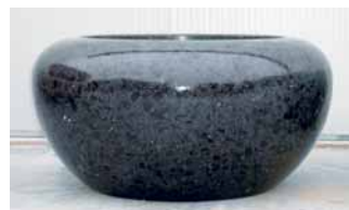
Apollonia -marmori/betoniallas. Väri vaihtoehtoja, epoxy-pinnoite. Altaassa ei ole kaltevuuden säätöä.