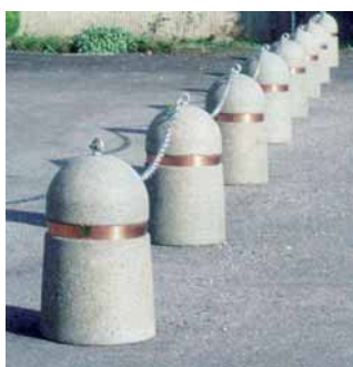
Alto tipo 22 Ø (mm) Korkeus (mm) Paino (kg) 445 720 210