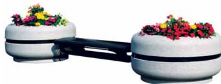
Zebra-penkkielementti ja Classica-allas

Penkkielementin väri RAL 7021 harmaa. Penkin pituus 1500 mm, selkänojalla tai ilman. Myös kahteen suuntaan istuttava Duetto-malli. Allas Ø 820 mm, ryhmän pituus 3320 mm. Allas Ø 1220 mm, ryhmän pituus 4120 mm.