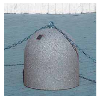
Bologna Ø (mm) Korkeus (mm) Paino (kg) 500 515 200