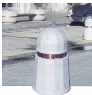
Alto tipo 21 Ø (mm) Korkeus (mm) Paino (kg) 404 720 182