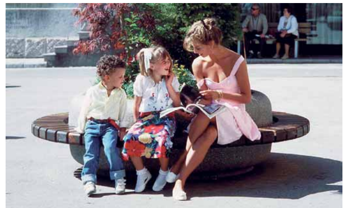
Iroko-puupenkki ja Classica-betoniallas yhdistelmä Allas Ø 1220 mm, koko Ø 1760 mm. Allas Ø 1620 mm, koko Ø 2160 mm.