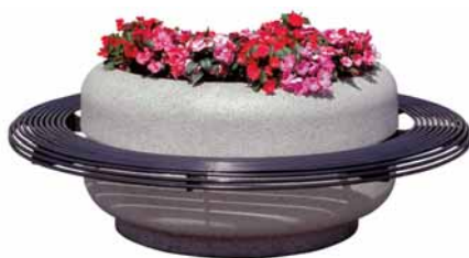
Saturnia-teräspenkki ja Classica-allas

Istuin- ja selkäosa 15 mm:n teräspuutkea. Harmaa RAL 7021 pinnoite tai ruostumaton teräs. Pituus 1500 mm, korkeus 729 mm, syvyys 635 mm.