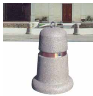
Alto tipo 2 Ø (mm) Korkeus (mm) Paino (kg) 500 720 182